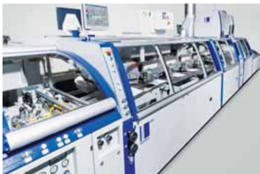
3. ábra. Kolbus KM600 ragasztóköti gép

het szállítószalagos adagolás is, alsó vagy felső ívlehúzással. Az alsó ívleválasztás csak a Kolbusnál rendelhető, mely hasonlít a ZU841 ívösszehordó gép állomásainak működési elvéhez. Előnye a biztos adagolás mellett, hogy a borítókat utántöltéskor nem a köteg alá, hanem a felsőívre kell helyezni. Ez egyszerűbb és gyorsabb munkát eredményez.