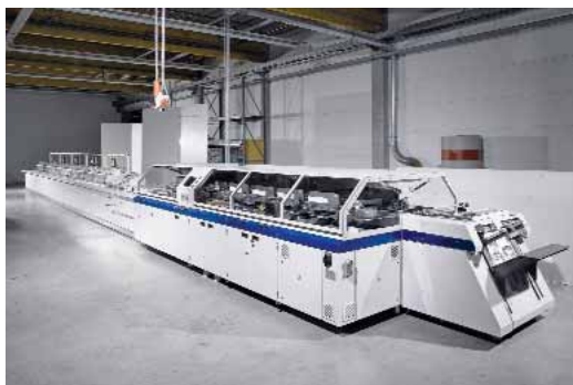
4. ábra. KB4310 ragasztóköti gépsor

A Kolbus védjegyének számító IR-melegítővel ellátott ívelt vezetés után a KM600-as gépen egy rotációs borítóadagoló helyezkedik el. A nagyobb termelékenységű gépeknél le-