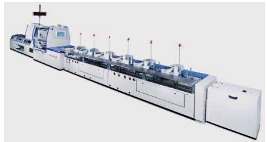
2. ábra. Kolbus ZU832 ívösszehordó gép

igényel kiegészítő elemeket az ívek felgyorsításához. Mindezeknek köszönhető a fentebb említett nagyobb termelékenység, mely a teljes gyártósorra vonatkoztatható.