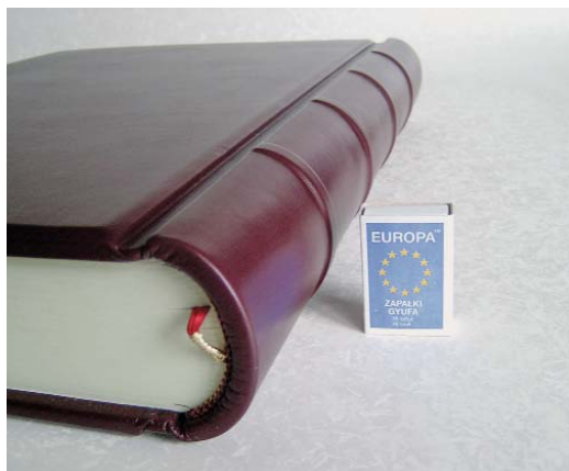
Bőr borítású, ugróhátú kötés

zeumban (Komárnóban) a könyvkötőmesterek kiállításán. Azért lelkesedtek e munkáért, mert a kétszáz évesnél is régebbi könyvek helyreállítása tisztelgés az elődök előtt, és eredeti állapotukba visszaállításával újból díszíthetik a könyvtár polcait.