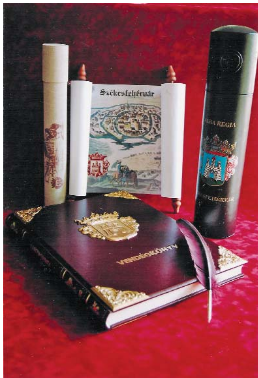
Bőrborítású, gerincaranyozással, veretekkel díszített könyv, szitanyomtatású díszdobozokkal