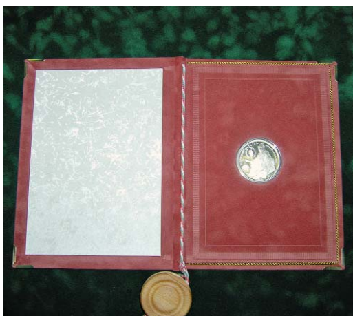
Oklevél- és éremtartó

A könyvbe a települések polgármesterei rögzítik gondolataikat a helyi értékekről. 2008-ban a munkáikkal részt vettek a Duna Menti Mú-