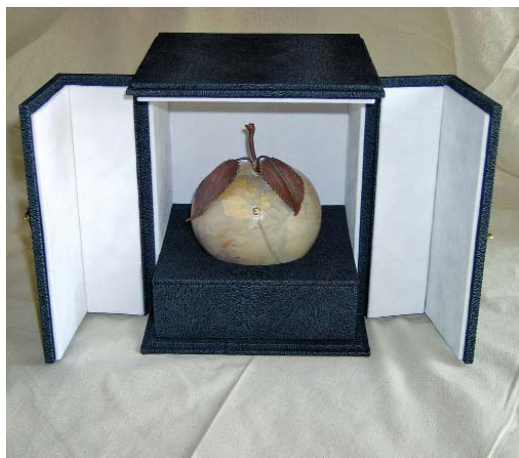
Az Országalma díszdobozban

Az igazi örömet és boldogságot a szakmaszerető kézművesnek az jelenti, ha minél régebbi, minél nehezebben helyrehozható könyvet varázsol ismét széppé. Ehhez azonban szív és lélek is kell a szakmai tudás mellé. A 35 év alatt megszámlálhatatlan családi könyvtárban, intézmények polcain megtalálhatók a könyvkötő házaspár által elkészített könyvek, díszdobozok, ékszerszertartók, albumok, mappák stb.