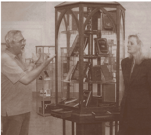
A Mórocz házaspár