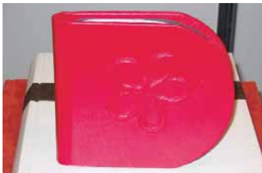
Cd-tartó domborított bőrborítással

Köszönjük a bemutatkozási lehetőséget. Bízunk abban, hogy a következő kiállításon ismét nyílik rá lehetőség, hogy itt lehetünk, s megmutathatjuk ismét a könyvkötés szakma szépségét a kiállítást meglátogatóknak.