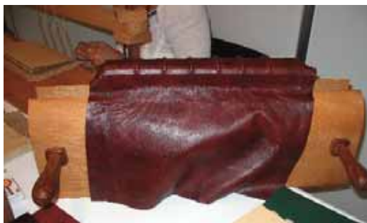
Betáblázott kötés 1/1 bőr borításának első fázisa