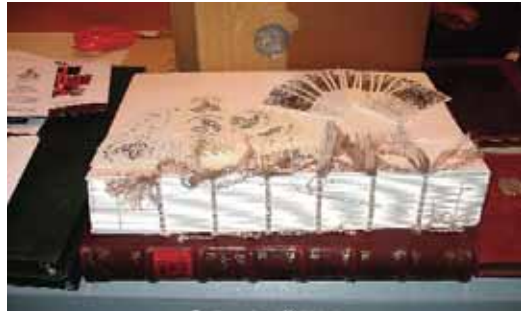
Bordavarrással fűzött ívek

A mesterek által kizárólag kézi műveletekkel, nagy szakmai tudással, lelkesedéssel készített munkák (restaurált könyvek, díszdobozok, ékszertartók, albumok, mappák, formatervezett dobozok, oklevél- és éremtartók stb.) művészi szinten mutatták be a könyvkötőszakma szépségeit.