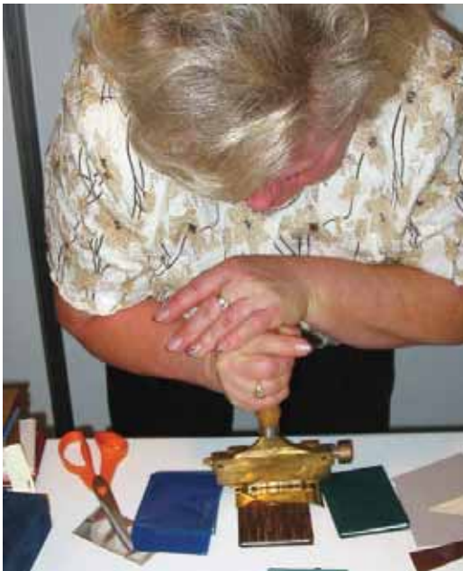
Könyvkötőmester mini könyvet aranyoz kézi betűszorítóval a látogatók részére

A kiállításon a könyvkötő kisiparos szakemberek is megjelentek a termékeikkel egy standon. A látogatók nemcsak a kiállított munkáikat nézhették meg, hanem az egyes folyamatok látványos, nagy kézügyességet, tapasztalatokat igénylő kézi műveleteit is.