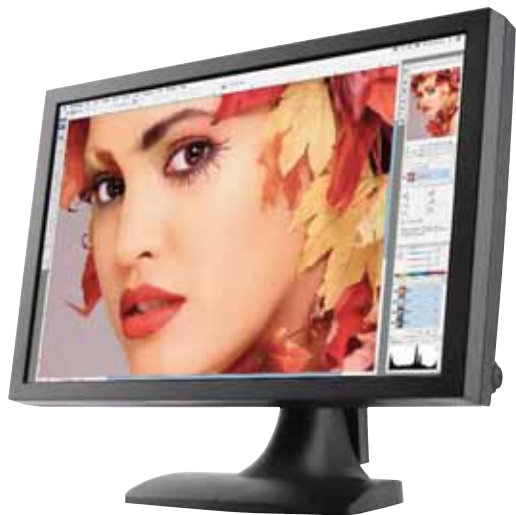
Quato Intelli Proof 262 excellence – 26 collos, csúcskategóriás hardverkalibrált TFT monitor, Fogra PreCert „A” osztály, 100% ISO Coated v2 lefedés

A nyomdai előkészítés berkeiben sokan hiszik, hogy elegendő egy softproofra alkalmas monitort vásárolni, és a probléma meg van oldva – a helyzet mégsem ilyen egyszerű. Történelmi okoknál fogva az elterjedt, személyi számítógépeken futó grafikai szoftverek színkezelési eljárása ugyan rendkívül gyors, viszont