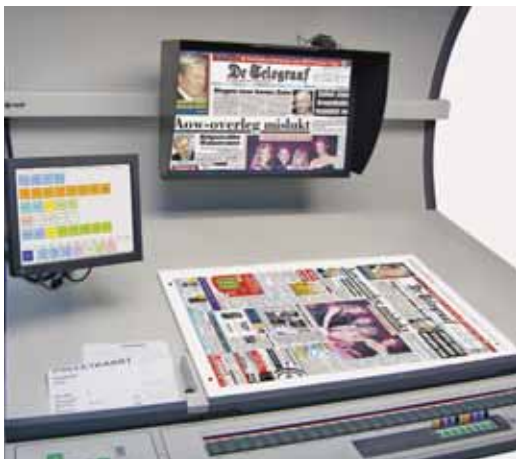
Softproof a gépteremben. A gépmester dolga egyszerű, hiszen minden oldalhoz van vizuális referencia

kor a költséghatékonyság igénye és az időhiány ma gyakran oda vezet, hogy sok anyag „vakon” kerül nyomtatásba, mivel a megrendelő nem küld semmiféle értékelhető referenciát anyagaihoz. Mihez áll ilyenkor a gépmester? Hogyan dönt, ha szaktudása és a józan ész már nem segít? Ilyenkor jönnek a hosszadalmas, nehézkes beállítások, a gépből kivett, majd visszaemelt munkák, a megnövekedett hozzálék – mely tényezők érvényesítése a számlában éppoly nehéz (vagy lehetetlen), mint több nyomtatott proofot kérni a megrendelések mellé.