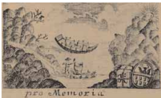
Josef Franz Kollmann másik kiadói jelvénye (Kolozsvár, 1779)

A 38 mm magas és 63 mm széles rézmetszet középpontjában egy hordókkal megrakott bár-