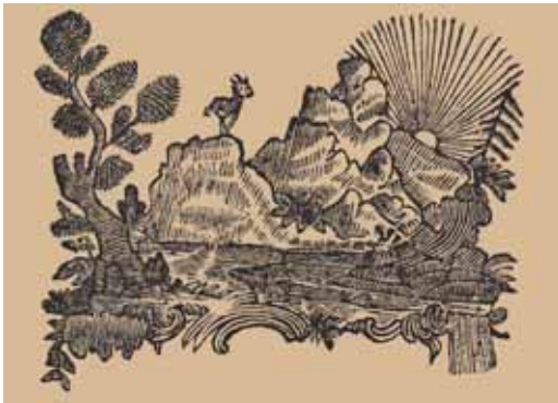
Josef Franz Kollmann egyik kiadói jelvénye (Kolozsvár, 1775–1787)

Josef Franz Kollmann a kolozsvári jezsuita akadémia nyomdájának volt a művezetője 1768-ban, majd a rend 1773-as feloszlata után az egyetemi nyomdává átlényegült officina bérlője 1774–1783 között. 2 Az 1727-ben Antalffy János erdélyi püspök (1724–1728) által alapított műhely mindenekelőtt az oktatást szolgálta tankönyvek és vizsgatételek megjelentetésével, de hitbuzgalmi munkák és a tanárok írásai is itt láttak napvilágot. A nyomtatványok nyelve zömében latin volt, csak 1750 után készült egyre több magyar kiadvány.