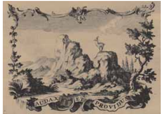
Georg Ludwig Schulz rézmetszetes jelvénye (Bécs, 1761)

Bár Ferenczi nem adja meg a nyomdász bécsi származására vonatkozó forrását, a most föl-