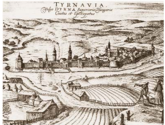
Nagyszombat metszete a 16. század végén

Miklós pápa okos dolognak tartotta Telegdi érvelését, és azt az utasítást adta, hogy a szellem fegyverével támadják az ellenséget.