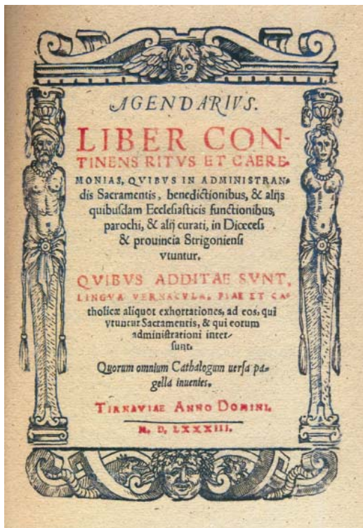
Telegdi Agendájának címlapja 1583

irata, azután Pázmány Péter írásainak is egy része. Az első magyar naptár 1579-re, amit aztán