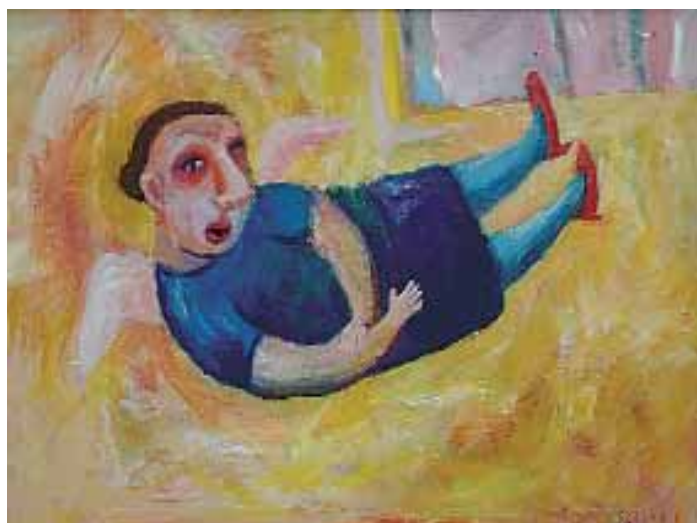
Balra: Angyal piros cipőben (festmény)