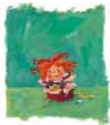
Fent: Luca meglepetése