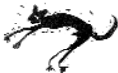
Jobbra lent: Illusztráció a „Luca” könyvhöz, mellette illusztrált naptár egy lapja: „Nyár”

Ebben a számban a vonalak után foltok, színek és tónusok pottyannak a papírra – ismét egy jellegzetes stílusú művész műtermében járunk.