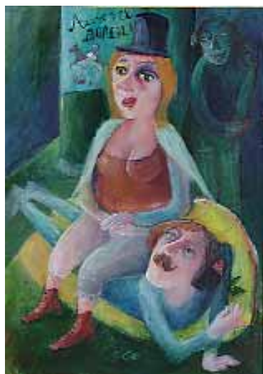
Fata Morgana (festmény), mellette illusztrációsorozat