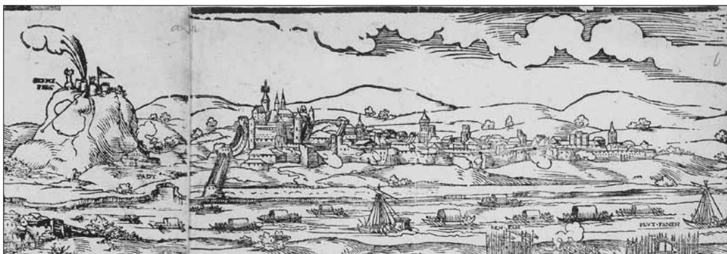
4. kép. A Nürnbergben őrzött Erhard Schön-metszet Buda látkép részlete