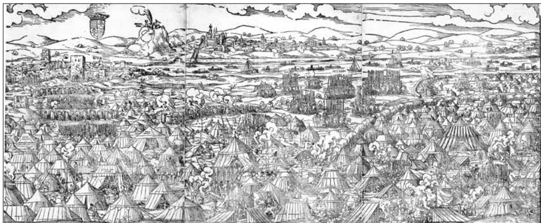
2. kép. A Nürnbergben őrzött, Erhard Schönnnek tulajdonított fametszet

Már első ránézésre is megállapítható volt, hogy ez a metszet nem azonos Erhard Schön Buda 1541. évi ostroma, nyugati nézetből készült metszetével, amelyen Hans Sachs verse is szerepel. 10 A Germanisches Nationalmuseumban őrzött metszet ugyanis keleti nézetű.