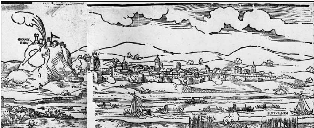
3. kép. A Virgil Solis-metszet Buda látkép részlete

Nem tudjuk, ki volt ez az ismeretlen rajzoló. Mindenesetre Buda várának az 1541-es Schön-metszeten feltűnő, szintén hitelesnek nevezhető látképe és az 1542-es látképen feltűnő Buda látkép összehasonlítása megegyező képi elemeket mutat, természetesen ellenkező nézetből. Így például Schön metszetén a Várhegy a valóság-