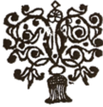
1. ábra. A sárospataki könyvdísz 1663-tól szerepelt a debreceni nyomtatványokban

Rosnyai Jánosról tudható, hogy 1657-ben a korábbi tipográfus, Renius György júniusi halálát követően vette át a sárospataki fejedelmi nyomda irányítását, amelyet annak 1671. októberi kényszerű menekítéséig vezetett. Az I. Rákóczi György erdélyi fejedelem és felesége, Lorántffy Zsuzsanna által 1650-ben alapított és támogatott nyomdatóműhely sorsa nehézségre fordult, miután fiuk, II. Rákóczi György fejedelem 1660-ban meghalt. Özvegye, Báthori Zsófia rekatolizált, ami által a sárospataki főiskola és a kollégium mellett a tipográfia is veszélybe került. Ezért a kollégium vezetése a Báthori Zsófia támogatását bíró jezsuiták elől – 1663–1665 között – a sárospataki fejedelmi nyomdát Bocskai István zempléni főispán máig nem tisztázott egyik zempléni