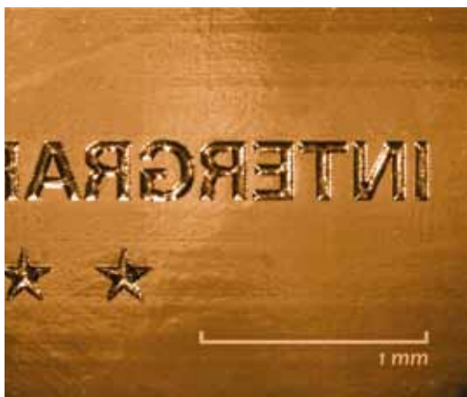
HD Flexo technológiájú klisé 1 pontos negatív szövege

Az igazi értékelést nyomdai partnereinktől és megrendelőiktől várhatjuk, osztályozni ők fognak. Bízunk benne, hogy ötcillagos kliséekkel kiérdemelhető a csillagos ötös.