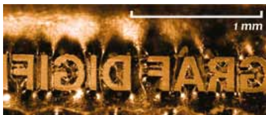
HD Flexo nyomóforma 1 pontos pozitív szövege

séget, megfelelő aniloxhengerekkel akár a 70–90 vonal/cm-es tartomány is megcélozható. A rasterpontok a korábbi 2400 vagy 2540 dpi-s felbontású lézerezéshez képest szabályosabbak, így az árnyalatok könnyebben, tisztábban nyomtathatók. Az új HD-s rácsosításokkal pedig a vetett árnyékoknál, kifutóknál az eddiginél szebb, finomabb átmeneteket érhetünk el.