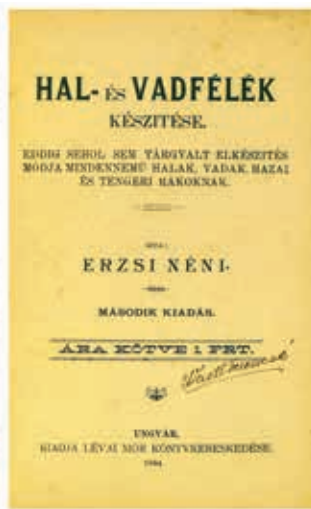
Ungvári szakácskönyv fővárosi kötésben (1894)