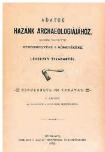
A munkácsi Kárpát Könyvnyomda egy kiadványa 1892-ből

A szerzői kiadások száma három. Az ismeretlen nyomdanévvel megjelent kiadványok közül 14-félét számoltunk össze.