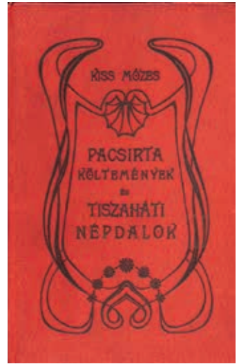
Beregszászi könyv díszkötése 1905-ből

A városban 1876 és 1909 között további hét hosszabb-rövidebb életű nyomda létesült. Az ismeretlen nyomdanévvel megjelent kiadványfélék száma tizenkilenc.