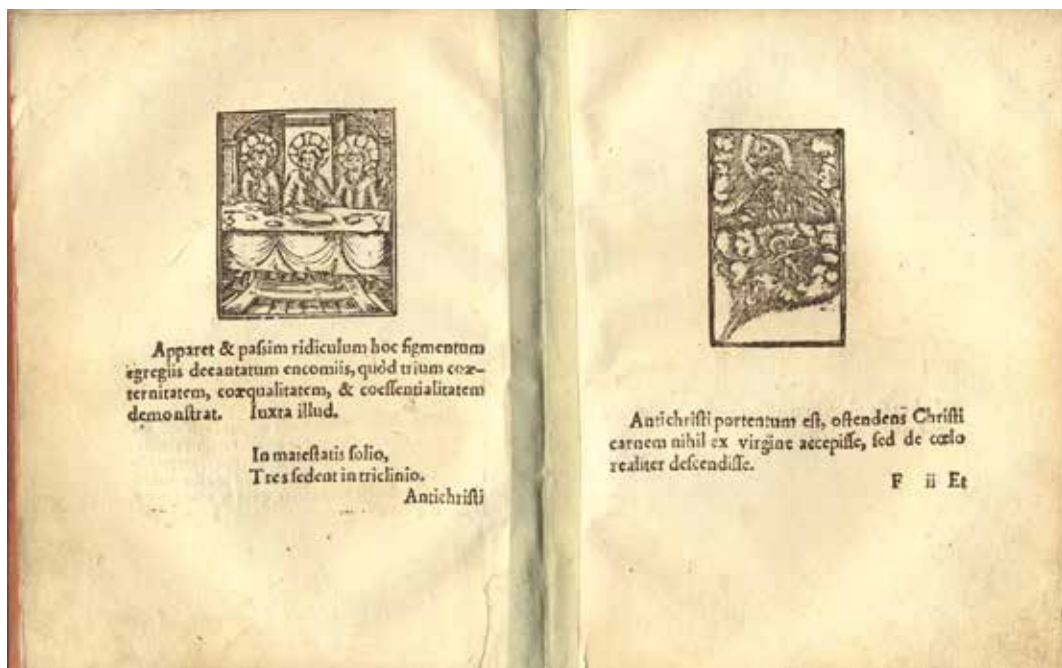
A De falsa et vera unis Dei patris című műben is szerepeltek a Szentháromságot kigúnyoló fametszetek