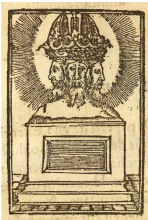
A botrányos fametszetsorozat egyik darabja