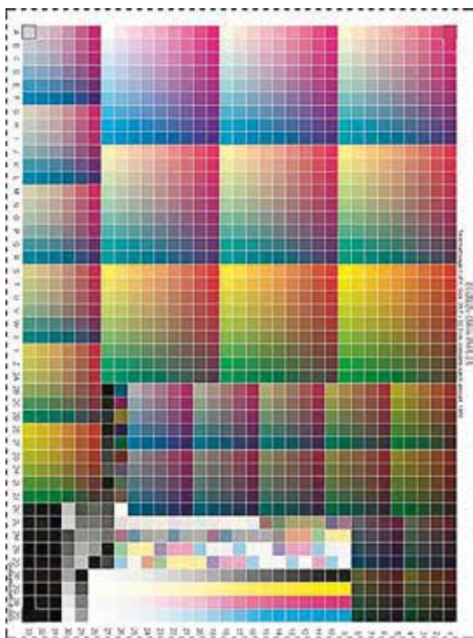
1. ábra. ECI2002V CMYK tesztábra

Nem hiszem, hogy létezik olyan ember, aki ezzel a kérdéssel ne szembesülne pályája elején. A nyomdagépen nyomtatott íven a tesztnyomtatáskor telített és többnyire sötétebb színeket lehet látni. Amikor egy képre színekonverziót alkalmazunk, a színmotornak kell egy kiindulási színprofil és egy célprofil, hogy a konverziót elvégezhesse, mert valamiből valamibe konvertál. A tesztábránkhöz nincs forrás profil rendelkezve, csak számértékek. A tesztnyomtatás során semmiféle konverziót nem alkalmazunk, csak arra vagyunk kíváncsiak, hogy mondjuk egy 100% ciánt és 30% bíbort tartalmazó mező milyen értéket ad lemérve az adott papíron. Amikor ezt az értéket egy másik színtérbe konvertáljuk, akkor azt feltételezzük, hogy az adott szín a forrás színtérben a megadott számértékekkel rendelkezik.