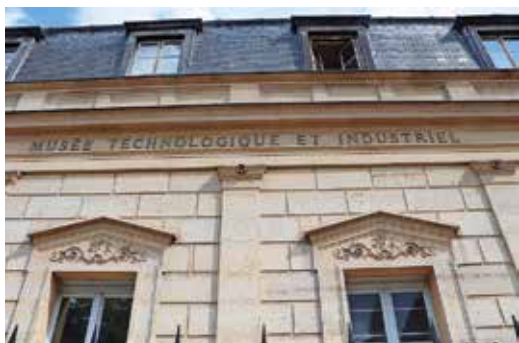
Le Musée des Arts et Métiers-Defies