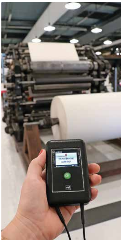
iBeacon – modern médiával a Gutenberg-galaxisért

tanak tematikus programokat diákok számára, ahol kipróbálhatják a papírmerítést, kötetési márványozást, szedést és nyomtatást.