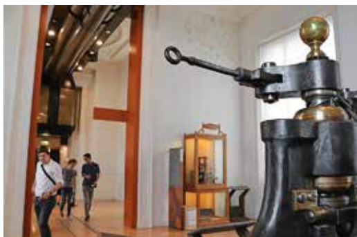
Charles Stanhope könyökösprése