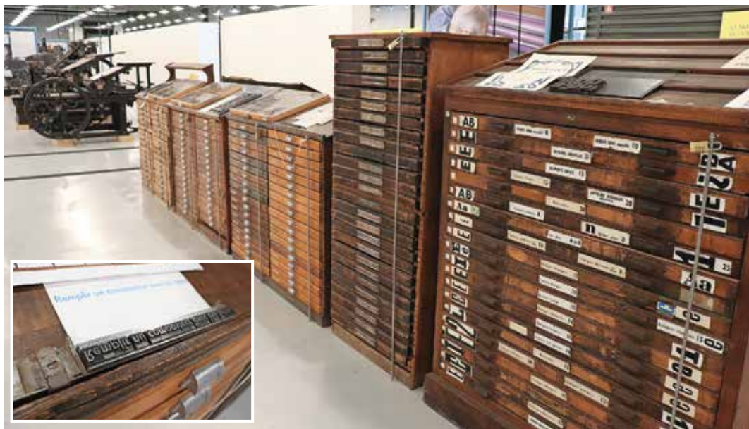
Szedőszekrények és regálók csatasorban

A múzeum nagy hangsúlyt fektet a múzeum-pedagógiai foglalkozásokra, rendszeresen tar-