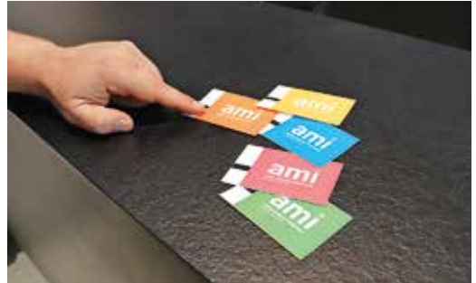
Egyedi belépőjegyek „Just in time”