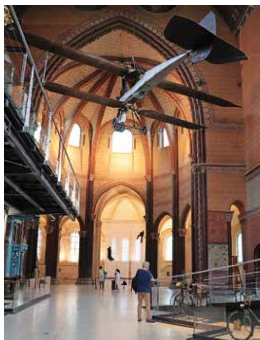
Léon Foucault-ingával a néhai templom kupolája