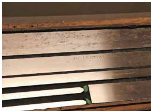
Itt őrzik a méter hiteles etalonját is!