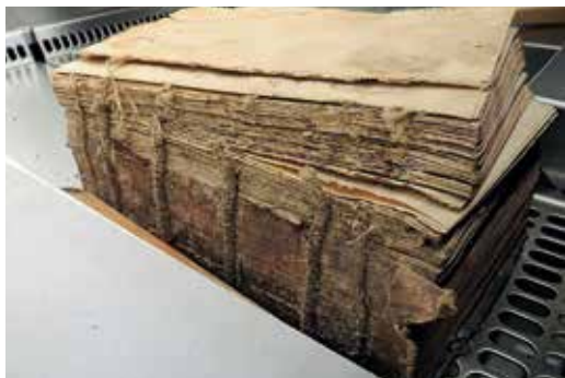
Penészkárt szenvedett könyvtest elszívókamrában

rátor státusz fenntartása. Az intézmény bevételeihez hozzájárulhat a külső megbízók részére végzett bémunka.