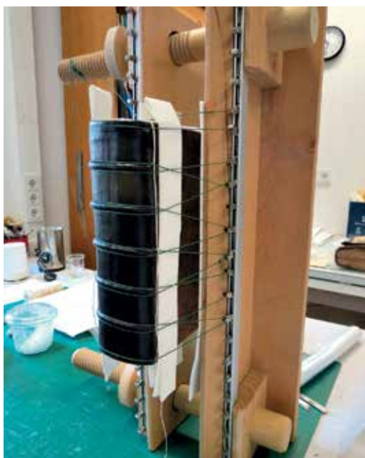
Bőrgerinccpótlás rögzítése fapréshen

A restaurátorképzés jórészt a könyvkötőképzésre épül, ami a gyakorlati munka alapja, vagyis a restaurátor egyúttal a szortiment könyvkötői tudásnak is birtokosa. Magas színvonalú munka