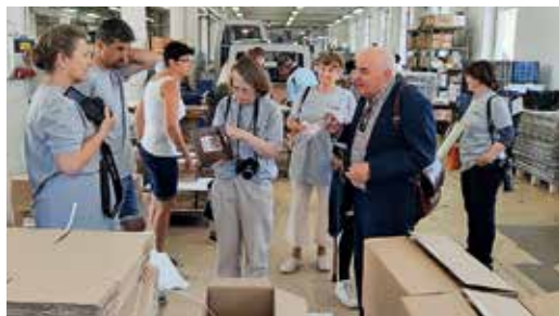
Gyomai Kner Nyomda

kezdve foglalkozott Kner Izidor, ám ennek minősége és mennyisége elsőszülött fiának, Kner Imrének munkába állása után változott meg. Imre rövid lipcsei tanulmány után 17 évesen lett a nyomda műszaki vezetője, aki a kor gyakorlatával szakítva megalkotta a barokk tipográfiát, melyhez Kozma Lajos készítette el a könyvdíszeket, iniciálékat, körzeteket és nyomdajegyeket. E korszak legszebb kiadványai a Három Cseppke Könyvek, Kner Klasszikusok, Monumen-