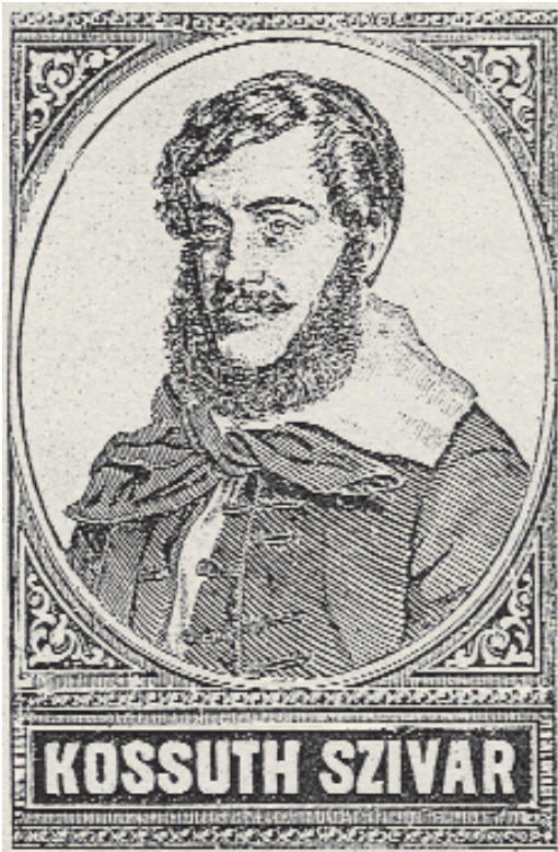
Szivadoboz címlapja, valószínűleg Welzel könyomdájából (1848)

Nagyszébenben 1822-ben Bielz Mihály alapítja az első litográfiai intézetet, melyben Barra Gábor elsajátítja az új művészetet, hogy azt mint nyomdabérlő Kolozsvárt művelje. Ugyancsak abban az időben a kolozsvári ref. kollégiumi nyomda is