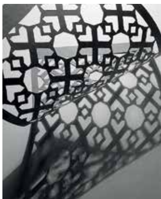
Veverka Gergő: Papírkísérletek, 2018