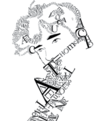
Barna Dóra: Tipográfiai feladat, 2021