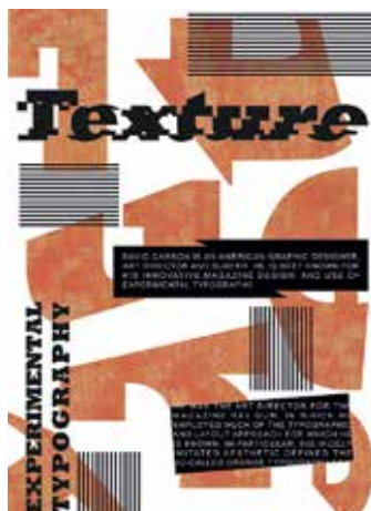
Führer Fanni: Tipográfiai gyakorlat, 2021