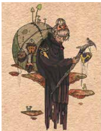
Izsai Regina: Illusztráció, 2018

A 2018-as Grafikarácsony papír karácsonyfadisz pályázatát