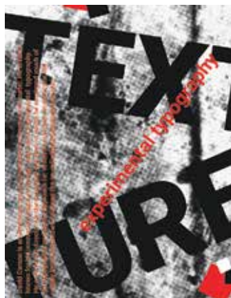
Fedor Noémi: Plakátterv, 2021