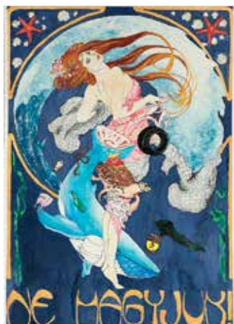
Fedor Ágnes: Parafrázis, tempera, 2018