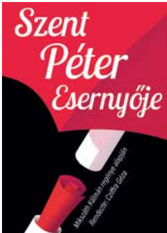
Csatornai Dóra: Plakátterv, 2020