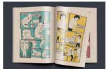
Fodor Brigitta: Képregény, 2020