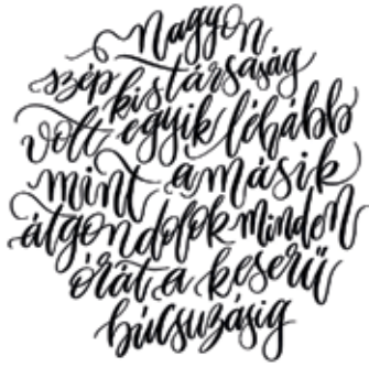
ADY ENDRE Harsányi Bertold: Kalligráfia, 2019