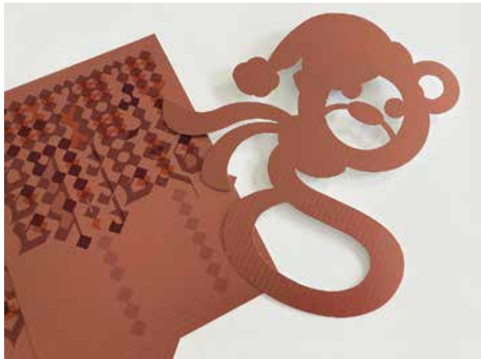
Fedor Noémi: Stancolt papírdísz, 2021

Gimnáziumi osztályokban, valamint hat szakmában folyik képzés: Néptánc, Kerámia-műves, Textilműves, Divat, stílus- és jelmeztervező, Festő és Művészeti grafikus szakon. Ez utóbbi a legnépszerűbb.