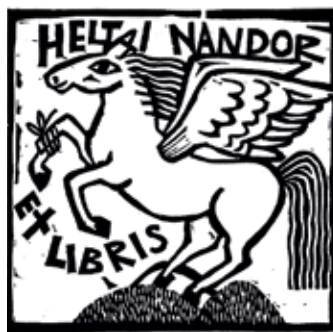
3. kép: Heltai Nándor ex librise. Bodri Ferenc alkotása

Az írásra, a költői ihletre reflektálóan a múzsák szárnyas lova, a pegazus jelenik meg a 2017-ben elhunyt Heltai Nándor újságíró, szerkesztő, közíró, népművelő, helytörténész ex librisén. (3. kép)