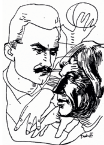
1. kép: József Attila és Nagy László. Bodri Ferenc alkotása

Alkotói pályája elején táblaképeket festett, olvasó és fésülő magányos nőalakokat, anya gyermekével kompozíciókat, csendleteket. Az 1970-es évek közepétől irodalmi művekhez készített illusztrációival hívta fel magára a figyelmet. A József Attilával és költészetével való belső azonosulás végigkísérte egész pályáját: a Medáliák , a Kertész leszek , a „Költőnk és Kora” , az Eszmélet , a Karóval jöttél című versek, az És ámulok... című töredék témavilága, képisége hosszú ideig foglalkoztatta, az ezek nyomán készült képek a legismertebb, legérettebb alkotásai. Emellett készített illusztrációkat Katona József Bánk bánjához , Csukás István, Nagy László verseihez, és Bodri-illusztrációkkal jelent meg Beregszászi János Tűzből mentett versek (Kecskemét, 1990) című kötete is. (1. kép)