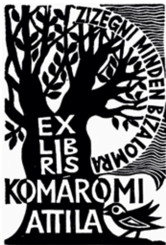
4. kép: Komáromi Attila ex librise. Bodri Ferenc alkotása

magunkba' / – ákácok, vigyá- zunk magunkra! – / az úri szélben ez a föladat". A költő úgy szól az akácfákhoz, mint- ha maga is közéjük tartozna, többes szám első személyben. A falevelek zizegése így válik a költő – és Bodri Ferenc – hangjává. (4. kép)