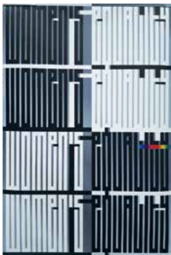
Balla Dóra – börtönszerű rácstipográfia: Womens equality