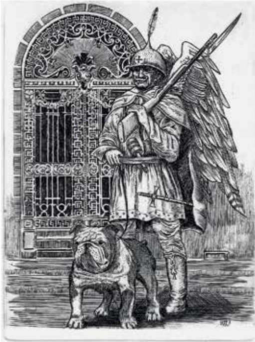
Vén Zoltán: Gábriel őrangyal

A kiállítás képein feltűnő állatok – orrszarvú bogár, hal, polip, hangyász, madár, disznó, kutya, mitikus sárkány és fönix stb. – részben az emberrel való kapcsolódási pontjukban jelennek meg (erre példa Herczeg István Zsákmány című alkotása); részben önmagukban, megszokott élette-