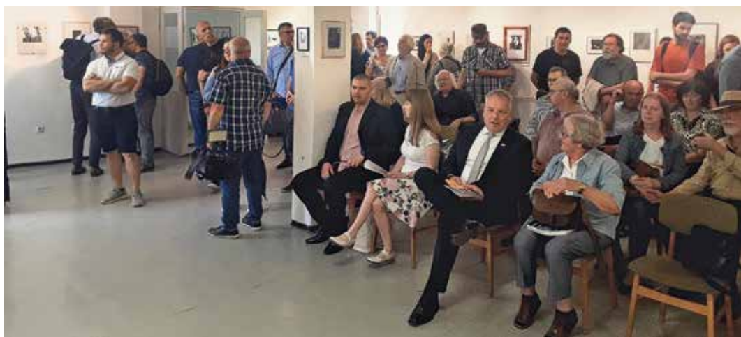
A közönség (Hatvani Galéria)

Mielőtt belekezdének a részletes bemutatásba, emlékezzünk meg a 2021-ben elhunyt, a Nemzet Művésze címmel kitüntetett Gyulai Líviuszról – a kiállítás egy része tisztelgés az ő munkássága előtt. A Kossuth-díjas grafikusművész így nyilatkozott a művészet szerepéről: „Utazóféle vagyok. De sosem csak átutazó. Arra vágyom – s tudom, e kívánságom mind elérhetetlenebb –, hogy elidőzhessenek egy-egy munkám világában, a képzelet számomra nagyon is valóságos színhelyén.” Engedjék meg, hogy e vezérgondolat jegyében most én is – kilépve a valóságos időből és térből – a jelen pályázat képei által egy képzeletbeli utazásra hívjam Önöket, hogy együtt élhesük át, amint a képzelet valósággá válik!