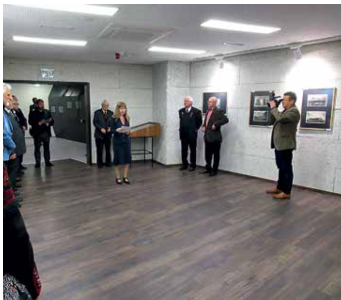
A kiállítótér részlete

Én is kívánok mindannyiunknak jó szerencsét és új felfedezéseket a változatos képanyag szemlélése során! A tárlatot megnyitom!