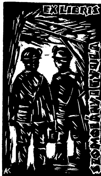
Andruskó Károly fametszete

A magánszemélyek mellett intézmények nevére is készül-