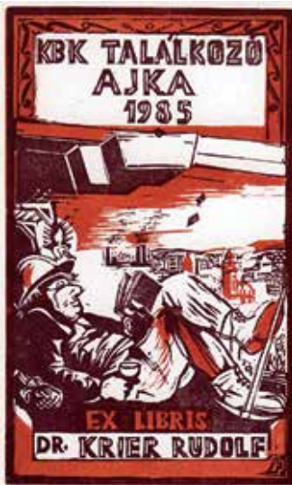
Úrmös Péter linómetszete (1985)

Nagy László Lázár (1935–2019) ceglédi grafikus két bányatörténetet bemutatató, mozaikos grafikája 1985-ben, az ajkai országos kisgrafikai kiállításra készült. Az egyikben szerepel tárlatunk már említett mottója a bányászattörténet ismeretének fontosságáról a múltat, a jelent és a jövőt illetően. A másikon a grafikus azt a folyamatot mutatja be, ahogyan a múlt bányászáának hagyományos eszközeit, a pisálkoló mécesest, a csákányt, a lapátot, a csillét fokozatosan kiszorítják az új, modern eszközök. Utóbbi kép középpontjában bányabeli robbantás látható, melyre a világon először