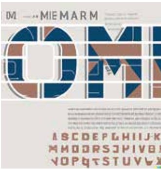
Humanista betűtípus, oldalterv modern fotókkal

Nem véletlen, hogy az Adobe béta teszten lévő Firefly alkalmazáscsomagja pont ezekre a területekre összpontosít az intelligens képkorrekciók továbbfejlesztése mellett.