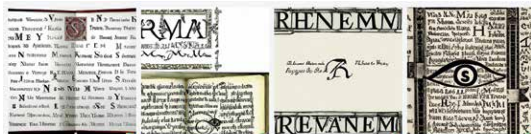
A kevesebb olykor több. Egy reneszánsz könyvterv szemből nézve, humanista antikva betűkkel és iniciáléval