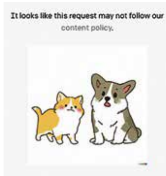
Dolgozik a cenzor

A képgeneráló programokért fizetni kell, ahogy a képügynökségi fotók használatáért is. (Érdekesség, hogy a Shutterstock már nyújt képgenerálási lehetőséget a DALL-E 2 erőforrásait használva.)