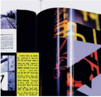
Modern tipográfia, oldalpár groteszk betűkkel, geometrikus elemek absztrakt fotókkal

Egyelőre, ha spórolni akarunk a tervezési időn, jobb, ha templateket használunk, mint AI generálta layoutot.