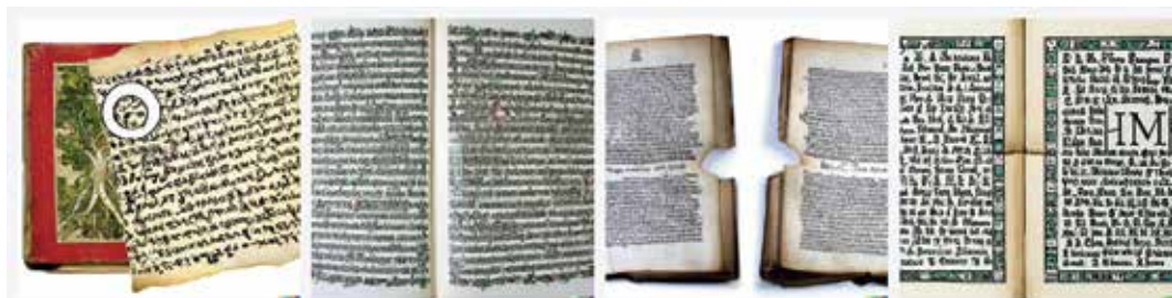
Elég lehangoló az eredmény. Egy reneszánsz könyv oldalpár szemből nézve, humanista antikva betűkkel és iniciáléval, valamint egy illusztrációval, ami a perspektivikus szerkesztést magyarázza

A legújabb AI alapú generátorok ennél sokkal több lehetőséggel kecsegtetnek bennünket.