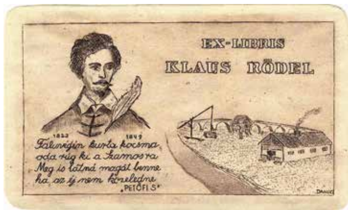
5. ábra. Dániel Viktor grafikája

Barabás Miklós tusrajza kiemelkedő jelentőségű a Petőfi-portrék sorában. Barabás 1846 nyarán Petőfi Összes költeményei első kiadásához rajzolta le a költőt, a kötet a rajz nyomán készített acélmetszettel a címlapon és díszes vörös szaténkötésben jelent meg 1847. március 15-én. A könyvön is szereplő rajzot vette alapul a 20. században Dániel Viktor félig portrész, félig illusztratív jellegű grafikája. (5. ábra)