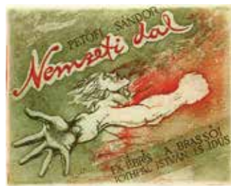
Bálint Ferenc grafikája

Petőfi Sándor műveinek ex libriseken való illusztratív megjelenítéséről Vasné dr. Tóth Kornélia az Országos Széchényi Könyvtár blogján írt, mely a következő linkről érhető el: https://nemzetikonyvtar.blog.hu/2023/03/16/_petofi_200_a_kolto_alakja_es_muvei_ex_libriseken_masodik_resz . Az ott szereplő ex librisek közül egy példa: