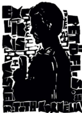
8. ábra. Bakacsi Lajos linómetszete (2017)

a panteon klinkertégláit is felidézi. A szobor a szegedi 1848-as megemlékezések kultikus helyszínévé vált. (8. ábra)