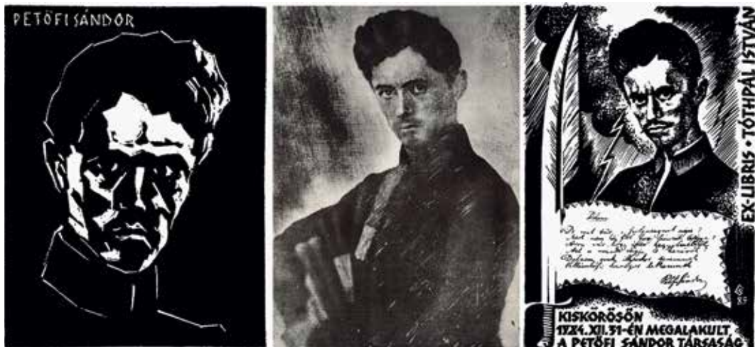
3. ábra. Petőfi Sándor alakjáról fennmaradt dagerrotípia (középen), Andruskó Károly fametszete (balról), Csutak Levente linómetszete, 1985 (jobbról)

a történeti, tárgyi világ is, amelyben Petőfi élt és alkotott, máskor valamely költeményének motívumvilága nyer képi megjelenítést. Több ex libris Petőfi leghitelesebb mellképét, a dagerrotípiát idézi. Ez a költő alakjának tükörképét mutatja sötét ruházatban, magasan záródó zsinóros atillában és a nyaka köré tekert hosszú nyakkendőben, jobb karjával egy biedermeier székre támaszkodva. (3. ábra)