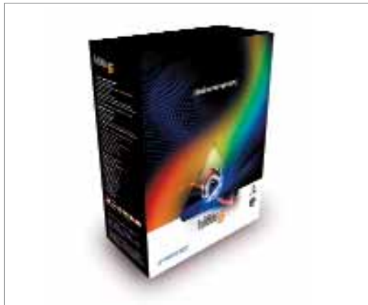
ProfileMaker professzionális ColorManagement szoftverének is a legújabb továbbfejlesztett változata, az 5.0.7-es

Ugyanebben az időben jelent meg a ProfileMaker professzionális ColorManagement szoftverének is a legújabb továbbfejlesztett változata, az 5.0.7-es. Ezt a szoftvert is kompatibilissé tették az új Mac számítógépekkel, illetve Windows operációs rendszerrel. Emellett új mérési módok is helyett kaptak a szoftverben, aminek használatával alacsonyabb felbontású tesztábrák is mérhetőek, illetve az iO asztallal egy szín is mérhető, így lehetőség nyílik egyszerű összehasonlításra