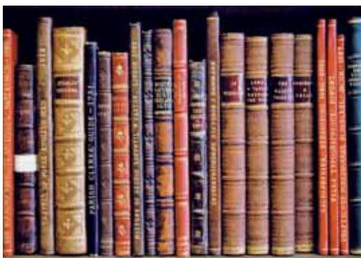
Baldes library könyvei

A gyűjtemény két fő része a kölcsönözhető és a nem kölcsönözhető könyvekből áll. A kölcsönözhető könyvek az olvasóteremben találhatóak, köztük vannak a főbb témákat lefedő általános könyvek és a legújabb folyóiratok.