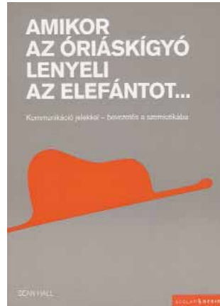
Mérete: 185×260 mm; terjedelme: 176 oldal Kötés: kartonált, ragasztókötés; ára: 5995 Ft (on-line vásárlás esetén 4800 Ft www.scolar.hu )

képződik a jelentés. A kérdésekkel kísért példák különösen azoknak a kreatív embereknek a tetszését fogják elnyerni, akik szeretnék még alaposabban megérteni a vizualitás nyelvét, és a jel-elméleti fogalmakat munkájuk során is hasznosítani akarják.