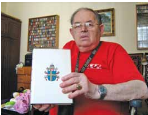
VI. Pál pápának készített, aranyművészettel díszített könyv