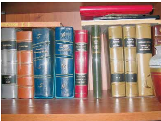
Bőrborítású, betáblázott könyvek kézi aranyozással

A hatvanas évek végétől a szakmunkástanulók gyakorlati oktatását odaadással, lelkiismeretesen végezte. Több tanulója az országos könyvkötőtanulók versenyén helyezést ért el, és ezért fél évvel előbb tehettek szakmunkásvizsgát.